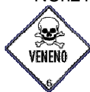
Rótulo peligro principal