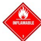
Rótulo peligro subsidiario